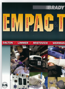
Manual do Curso (EN)